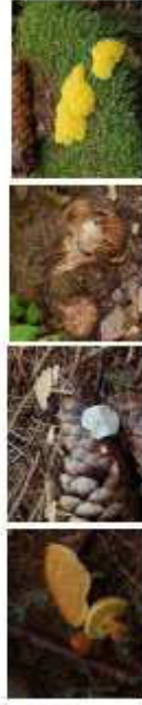
Goßkröhrling Mausschwänzchen Erdstern Gelbe Lohblüte

Der Kursleiter ist Forstoberrat, Pilzsachverständiger und profunder Kenner der Wälder um Hüttenberg. Man sammelt Pilze, welche dann abends bestimmt werden. Eine köstliche Pilzmahlzeit ist vorgesehen. Festes Schuhwerk und ein Pilzmesser wird vorausgesetzt.